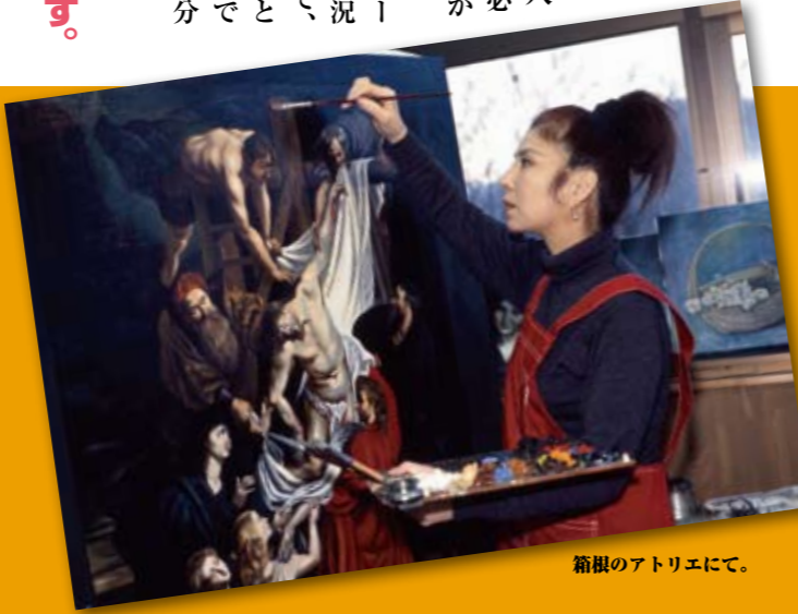
箱根のアトリエにて。

■ CD情報 ニューヨークのジャズクラブ「Birdland」でのライブを収録した、「夢の夜 八代亜紀ライブ・イン・ニューヨーク」が好評発売中 【画家としての活動】 世界最古の美術展、フランスの「ル・サロン展」で5年連続入賞を果たし永久会員となる。 今年10月30日から11月4日まで、鳥取県の天満屋米子しんまち店にて「八代亜紀絵画展」を開催。個展の開催やチャリティへの出品といった活動も積極的に行っている。 ●八代亜紀 Official Website http://yashiro.mirion.co.jp/