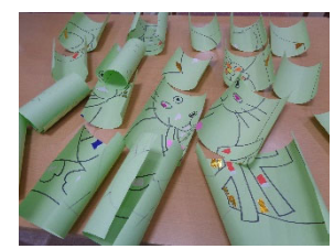
②作業しやすい大きさに切って