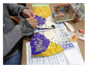
③細かくちぎった折り紙を ご利用者さまがひとつずつ 貼っていきます

作品をつなぎ あわせていくと、 横 107cm×縦 80cm の お正月らしい貼り絵作品が 完成です!!