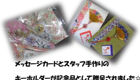
メッセージカードとスタッフ手作りの キーホルダーが記念品として贈呈されました☆

9月の敬老の日にあわせてユアエイビラデイケアでは『長寿を祝う会』を行いました。ご利用者さまから元気の秘訣を教えていただいたり、スタッフが楽器演奏やソーラン節を披露したりと笑顔あふれる楽しい会となりました♪