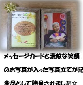
メッセージカードと素敵な笑顔 のお写真が入った写真立てが記 念品として贈呈されました☆