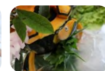
【使用した野菜】 大根・人参・カボチャ