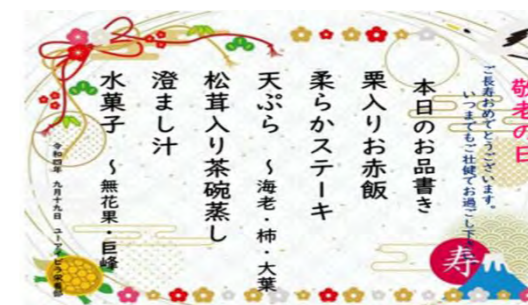
☆敬老の日特別メニュー☆