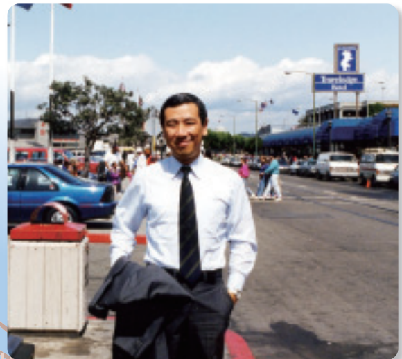
フィッシャーマンズ・ワーフ街にて

また美術館や記念館もあり教養が勝る日は静かなサンフランシスコを選ぶことも可能です。ここは住むには丁度良い規模の町で、観光場所も豊富にあり、夏には霧の町も見られ高層ビルの手だけが朝の挨拶をしてくれる。おまけに一年間の平均気温が18～20℃で、日の入りも遅く一日を十二分に有効に過ごすことができる所です。