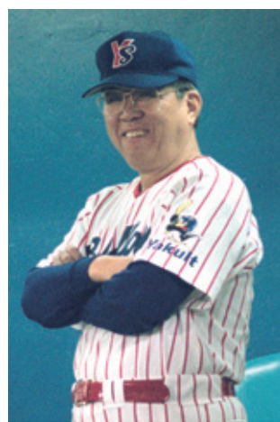
ヤクルト監督時代は「ID野球」でチームを導いた

とはいえ、どうしたら野球評論家になれるかわからない。女房に相談すると、「いい人がいるわよ」と紹介してくれたのが、評論家の故・草柳大蔵さんでした。