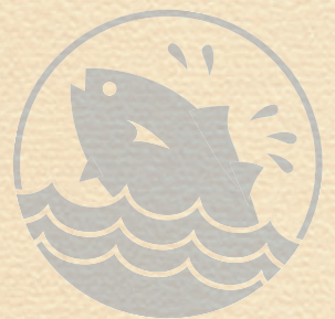
取材・文/凡平

に日本橋からの「移転」によって誕生したものです。当時の移転は、300年続いた日本橋の魚河岸(魚市場)が関東大震災で被災したためでした。場内の広さは東京ドーム5つ分に相当する約23ヘクタールで、取扱高は水産だけでも1日当たり約1600トンに上ります。 こうした居留地時代の築地と、かつての日本橋の魚河岸については、①タイムドーム明石(中央区立郷土天文館)のテーマ別展示で知ることができます。 築地のもう一つのランドマークが、江戸時代に建立された②築地本願寺です。現在のモダンな威容を誇る本堂は1934年に竣工したもので、当時としては珍しい鉄筋コンクリート造り。建物の屋根には、仏教寺院としては珍しく半円形のドームを構えています。 現在西北を向いている本願寺の本堂は、かつては西南を向いていました。その門前町には、築地市場の開設以降、水産物商などが入り、次第に形成されていったのが、